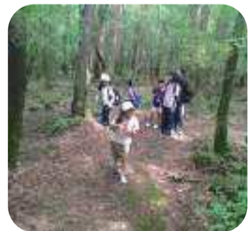
「富士の樹海を散策♪」