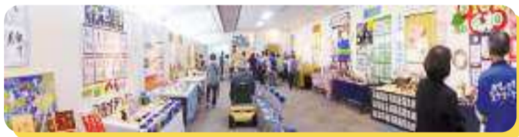
展示ブースが並ぶ展示室の全景