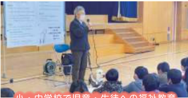
小・中学校で児童・生徒への福祉教育