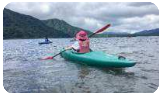
「湖上に自力で漕ぎ出すカヤック体験」