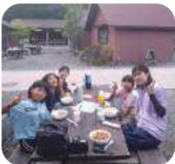
「みんなで食べるとおいしいね！」