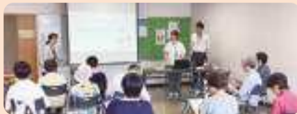
浅川市民センターで開催された「はちまるサポーター説明会」の様子

子ども食堂を運営している方や、地域で福祉活動をしている方も登録されており、地域活動中の参加者で気になる方がいたら「はちまるサポート」につないでいただいた事例もありました。