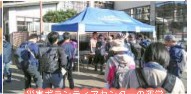
災害ボランティアセンターの運営