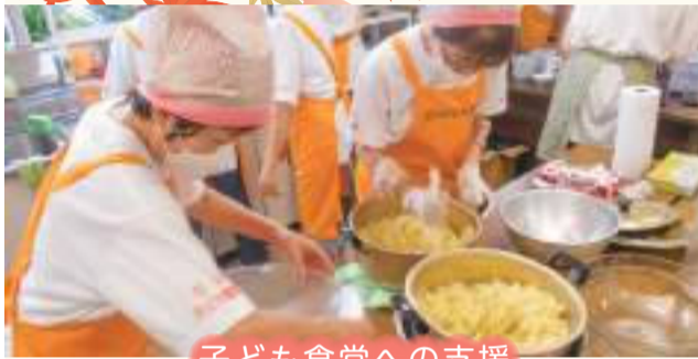
子ども食堂への支援