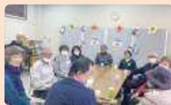
居場所活動の様子