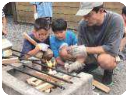
「まきで調理します。」

社会福祉協議会が運営する学童保育所では、毎年8月に3年生を対象に一泊二日の「社協がくどうキャンプ村」を開催しています。富士山のふもとにある西湖湖畔で、自然体験を通して仲間とのチームワークやリーダーシップを学びます。今年度(令和6年度)は、従来の食事作りやキャンプファイヤーに加えて、湖上でのカヤック体験が新たにプログラムに加わり、より充実した内容となりました。