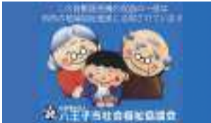
自動販売機には上のステッカーを貼らせていただいています。

どなたでもお気軽に地域貢献していただけます。 少しでも興味がある方は、下記連絡先までお問合せください。