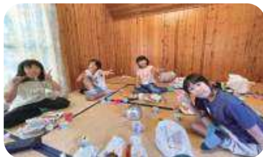
「バンガローに泊まりました」