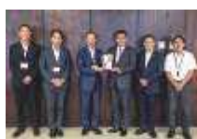
株式会社 村内ファニチャーアクセス様