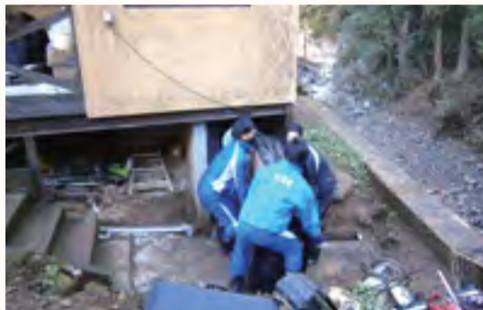
恩方地区ボランティア活動