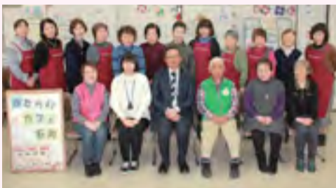
かたらいカフェ石川スタッフ

また、地域のボランティアの皆様が運営するコミュニティカフェ「かたらいカフェ石川」や、地域食堂「石川子ども食堂」の開催、学習支援「勉強お助け教室」の実施等、地域住民の方々の居場所となるような場としても活用をして頂き、5年間で延べ約2万5千人の方にお越しいただきました。今後も地域の身近な相談窓口として、また地域の皆様の居場所や活躍の場として地域福祉推進拠点をご活用ください。