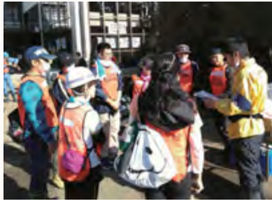
災害ボランティアセンター(浅川)オリエンテーション

八王子市との協定に基づき、本会は、被災にあわれた方々の生活復興を目的に10月19日から11月14日まで、災害ボランティアセンターを開設しました。開設した21日間で延べ1,730名のボランティアのみなさまに全国各地から駆けつけていただきました。多くのご支援を賜り誠にありがとうございました。