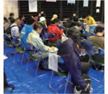
災害ボランティアセンター受付