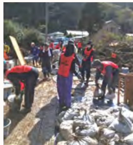
浅川地区ボランティア活動