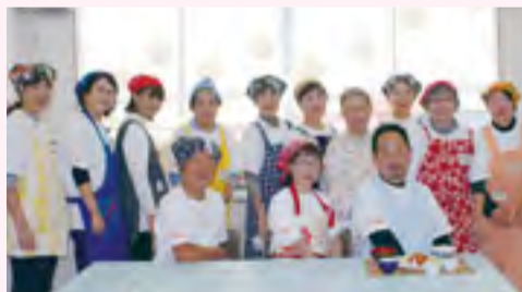
石川子ども食堂スタッフ