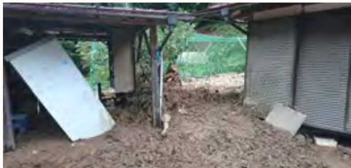
恩方地区被災家屋

災害支援活動の経験豊富な方々も多く駆け付けていただき、ご助言もいただきました。誠にありがとうございました。