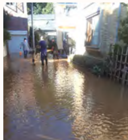
浅川地区被災状況