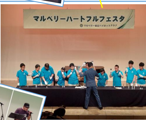
マルベリーハートフルフェスタ