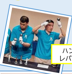
ハンドベルアンサンブル演奏 レパートリーは500曲以上!