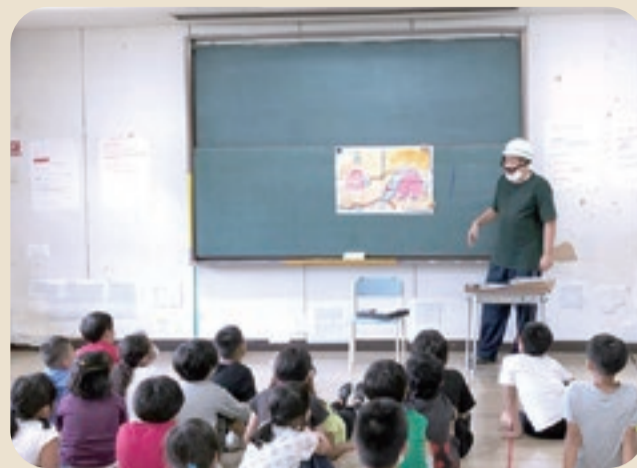
「落ち着いて行動しよう！」

これらの防災活動を通して、万が一の時に冷静に対応できるように、子どもだけでなく職員も日頃から防災について学んでいます。