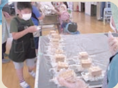
「乾パンを食べてみよう！」