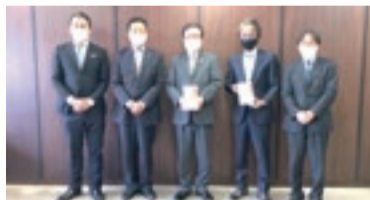
株式会社 村内外車センター様