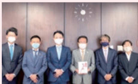
有限会社 村田石油 様