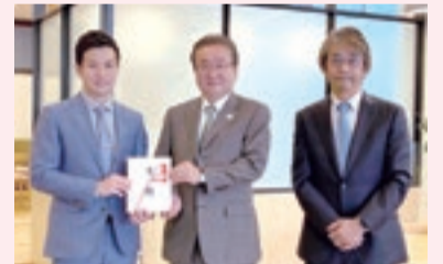
株式会社 住宅工営 様