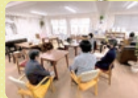
「ぶなの樹」活動の様子 来た人がほっとする雰囲気 で、自然と話に花が咲きます

誰でも出入り自由、過ごし方も自由。来た人同士で会話を楽しむのもOK。 話をしないでのんびり過ごすだけでも。