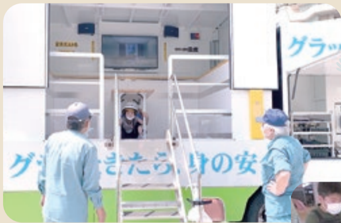
「起震車体験 こんなに揺れるの？」