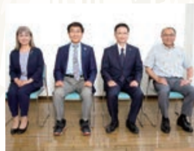
左から、谷合副会長、小室副会長、赤澤会長、山本副会長