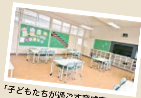
「子どもたちが過ごす育成室です♪」