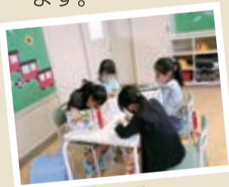
「宿題に取り組んでいま〜す☆」

学童保育所では、新年度を迎えてから3か月が過ぎ、新1年生も学童保育所の生活に慣れ、元気いっぱい過ごしています。新型コロナウイルス感染防止対策をとりながら、子どもたちが安全に楽しく過ごせるよう、日々の活動に取り組んでいます。