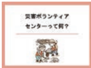
①災害ボランティアセンターって何 (3分22秒)

令和元年の台風19号で災害ボランティアセンターを協働して運営した南多摩5市(町田市・日野市・多摩市・稲城市・八王子市)の社会福祉協議会が、市民への災害ボランティア活動への参加促進やコロナ禍における災害ボランティアセンターでの三密回避を目的とした事前オリエンテーションとして、3本の動画を作成しました。災害ボランティア活動を行いたいと検討されている方、ぜひご覧ください!!