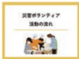
②災害ボランティア活動の流れ (7分05秒)