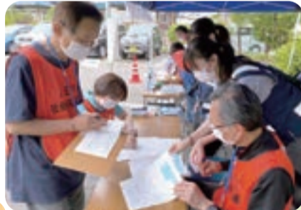
災害ボランティアセンター運営訓練