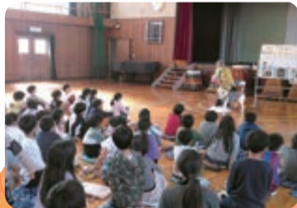
福祉教育(盲導犬との生活に関する福祉講話)

会員とは本会の事業に賛同し、地域福祉活動を財政面で支えてくださる方を言います。また、会員になることにより、「地域福祉」を自らの活動として受け止め、活動にご参加いただいているという意味も持っています。