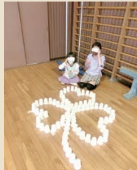
「紙コップを並べてクローバーの形にしました♪」