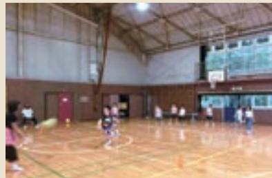
「体育館でドッジボール！」