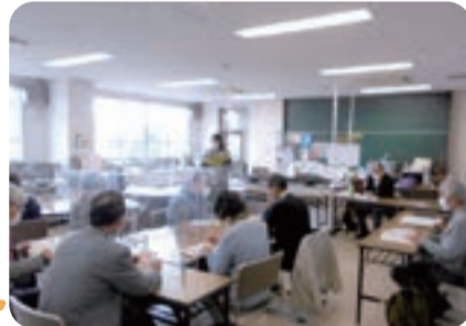
石川地域 勉強おたすけサポーター養成講座