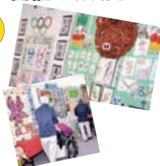
令和元年度に開催した時の様子