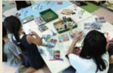
「ペットボトルを使った工作」