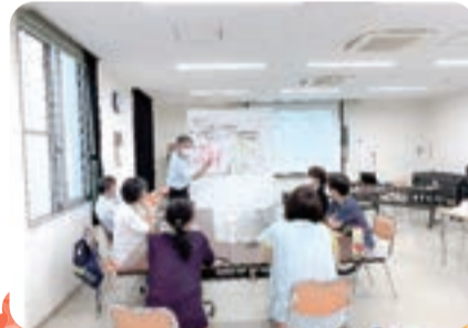
由井地域 子どもの居場所を考える会グループワーク

問合せ 市民力支援課(ボランティアセンター) ☎ 042-648-5776 FAX 042-648-6332