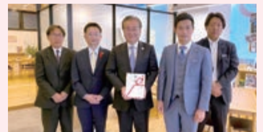
株式会社 住宅工営様