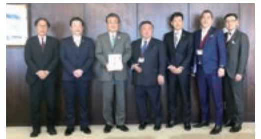
株式会社 エイト様