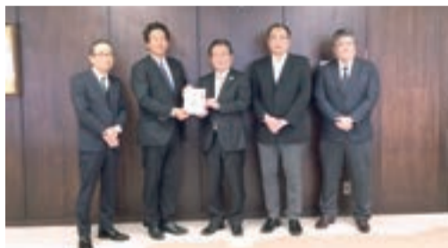
八王子・高尾・南大沢遊技場組合様