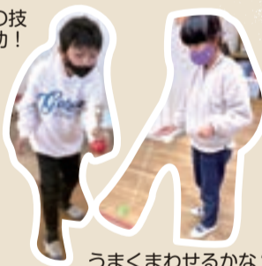
うまくまわせるかな?