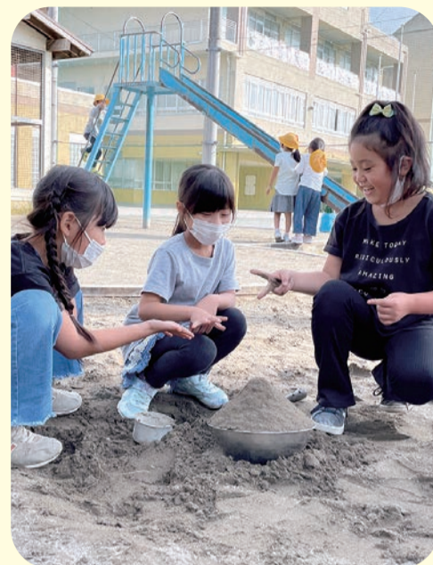
「誰が最初に砂山を崩すか決めよう! じゃんけんポン!」