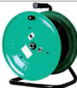
20m 可動型ドラム式ループアンテナ