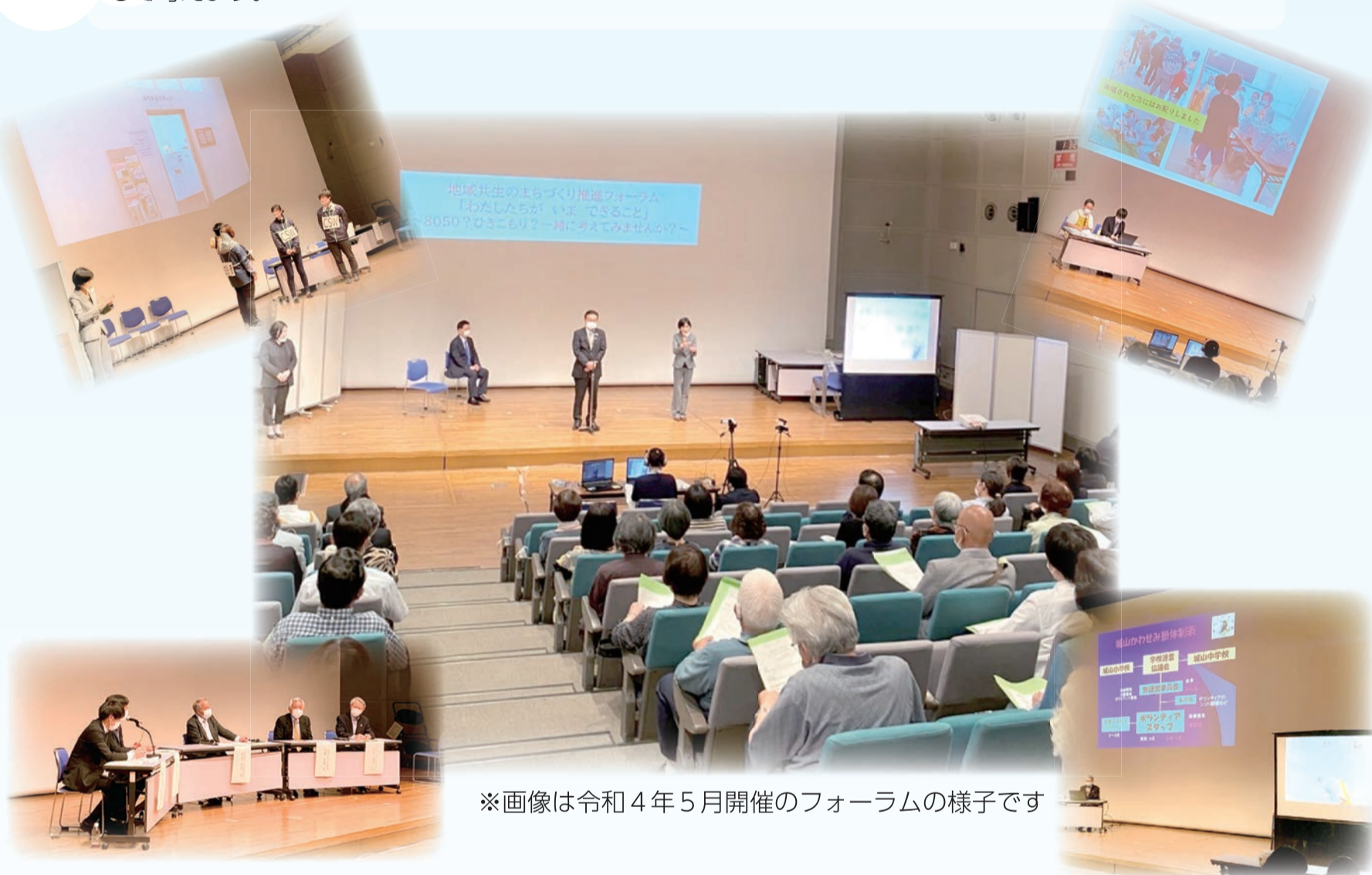
※画像は令和4年5月開催のフォーラムの様子です

どうすれば誰もが孤立せずに、安心して暮らすことができるかを、実際に支援活動を実施する方の話を通じて考えます。