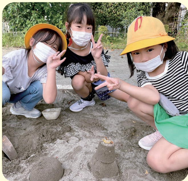
「おままごと中で～す!」

砂場遊びは、子どもの発達や成長を促す効果があると言われ、一人でも複数人でも楽しく遊ぶことができます。みんなで山を作ったり、団子を作ったり、おままごとをしたり、創造力を膨らませながら無限に遊びが広がります。友だちとの共同作業や物の貸し借りを通してコミュニケーションを深め合う場にもなっています。