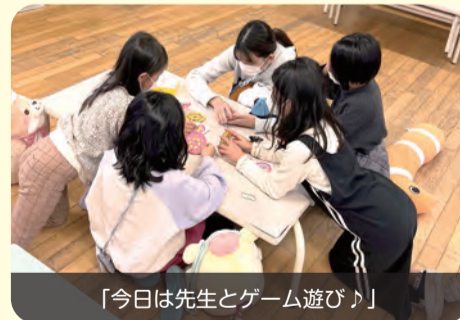
「今日は先生とゲーム遊び♪」