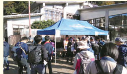
【令和元年東日本台風の活動の様子】

問合せ 市民力支援課（ボランティアセンター） ☎ 042-648-5776 FAX 042-648-6332