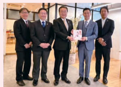
株式会社 住宅工営様

株式会社住宅工営様は八王子駅前に店舗をかまえ、不動産業等を営む会社で、毎年継続的にご寄付をいただいております。今年で30回目を迎える永年にわたる温かいご支援に、心より感謝申し上げます。