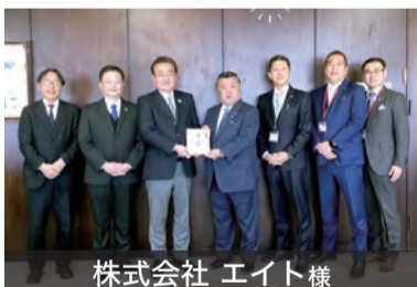
株式会社 エイト様