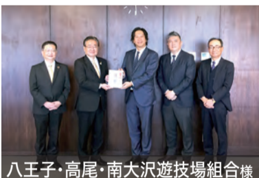
八王子・高尾・南大沢遊技場組合様