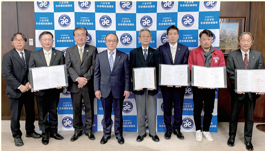
協定調印式の様子

地域のライオンズクラブと市区町村社協が「災害ボランティア支援に関する協定」に締結するのは都内初となっております。協定締結を契機に、有事はもとより、八王子の地域活性化を共に進めていければと考えております。