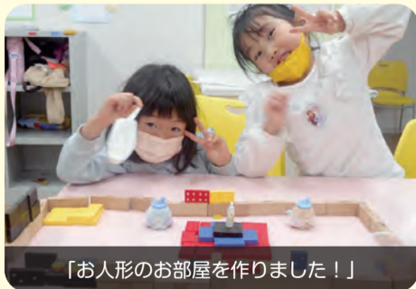
「お人形のお部屋を作りました！」

土曜日は、平日よりも利用人数が減ります。その分、普段は関わりが少ない異学年の友だちと遊んだり、職員ともいつも以上に深く関わる事ができます。また、遊具を少人数で思う存分使うことができたり、時間をかけてのんびりと少し遠くまで散歩に出ることもできます。「何して遊ぼうか。」「どこに行こうか。」等意見を出し合い、楽しく過ごしています。