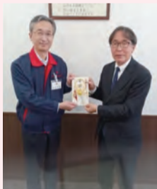
株式会社 スーパーアルプス様