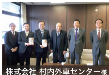
株式会社 村内外車センター様