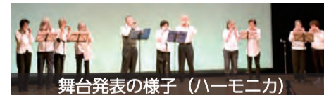
舞台発表の様子(ハーモニカ)