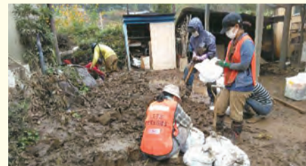
【災害ボランティアセンター運営訓練の様子】