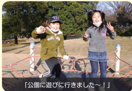
「公園に遊びに行きました～！」