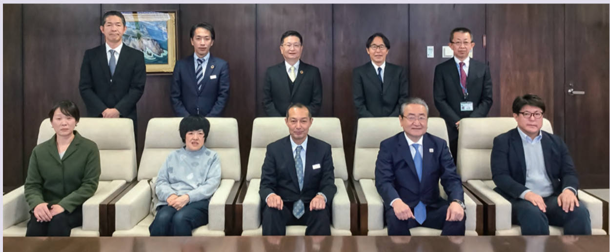
助成金伝達式の様子

地域福祉推進のための継続したご寄付に改めて感謝申し上げると共に、この度の助成により各団体の活動がますます発展し、地域福祉をさらに推進していければと思います。