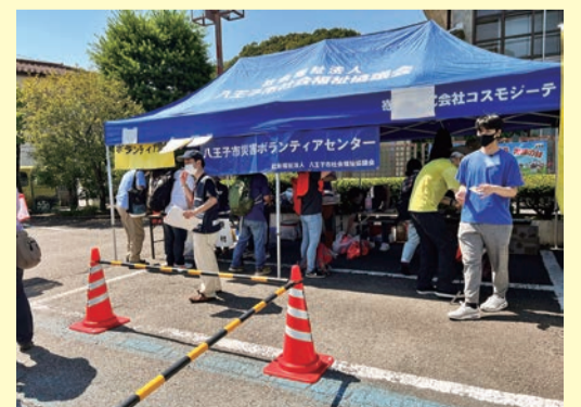
災害ボランティアセンター運営訓練の様子