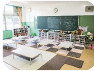
本を読んだり、遊具で遊べる、ゆっくりとくつろげる部屋です。