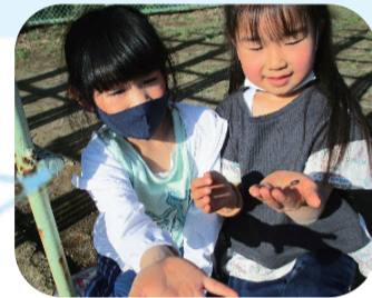
校庭でダンゴムシみつけました～♪

南大沢団地の中の集会所から、柏木小学校の1階に移転。施設名は「柏木小学童保育所」になりました。目の前が校庭で、すぐに遊びに出ることができます。