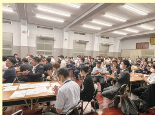
相互交流事業の様子