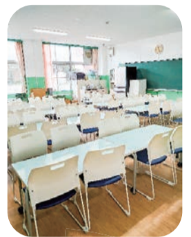
おやつを食べたり、宿題をする部屋です♪