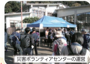
災害ボランティアセンターの運営