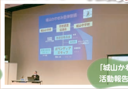
「城山かわせみ塾」の活動報告