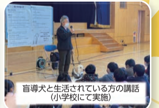
盲導犬と生活されている方の講話(小学校にて実施)