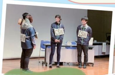
「ひきこもり」をテーマに寸劇している様子

昨今、社会問題となっている8050問題、不登校・ひきこもり、孤独死や生活困窮等は、きっかけや経緯は様々ですが、本人やご家族が問題を抱え込み、周囲と距離を置いてしまうことが多く、結果的に問題の長期化につながっています。どうすれば誰もが孤立せずに、安心して暮らすことができるかを、実際に支援活動を行っている方のお話を通じて考えます。