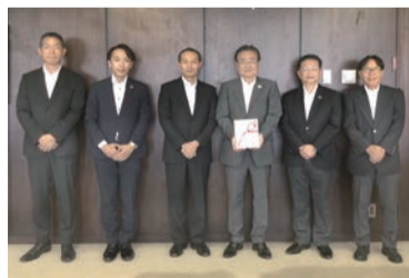
株式会社 村内ファニチャーアクセス様