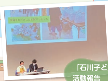
「石川子ども食堂」の活動報告