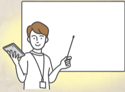
地域活動 / 講座 / イベント / こども食堂 / 住民の交流