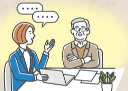
ひきこもり / 生活困窮 / ゴミ屋敷 / 福祉手続き