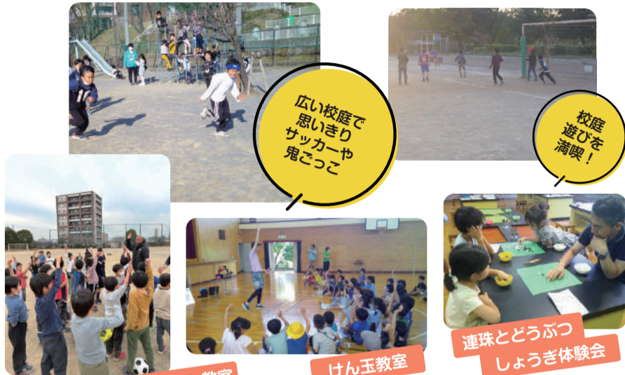
広い校庭で思いきりサッカーや鬼ごっこ

さまざまな遊びや体験、交流活動があり、新しいことにチャレンジしたり興味を持ったり、子どもたちの世界は日々広がっていきます。