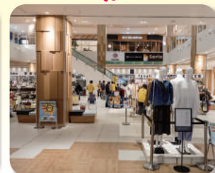
写真は昨年の様子です。