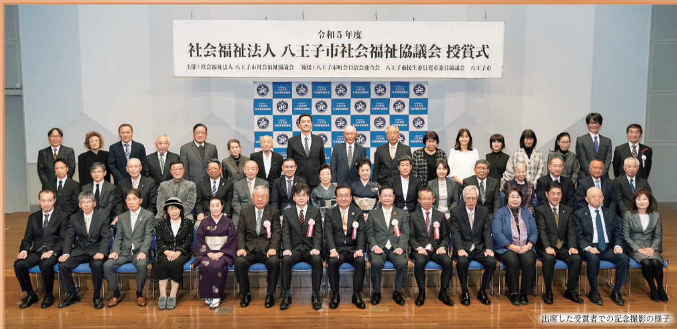
令和5年度 社会福祉法人 八王子市社会福祉協議会 授賞式

主催：社会福祉法人 八王子市社会福祉協議会 後援：八王子市町会自治会連合会 八王子市市民生活委員児童委員協議会 八王子市