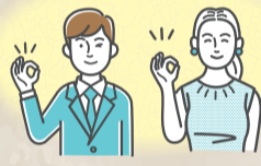
ボランティア / 物品寄付 / 現金寄付

市内に13カ所開設しています! お近くの「はちまるサポート」は 二次元コードよりご確認ください。